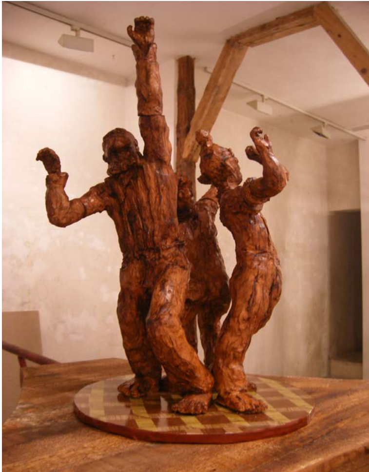
Hurdy Gurdy 2013 Detalle terracotas