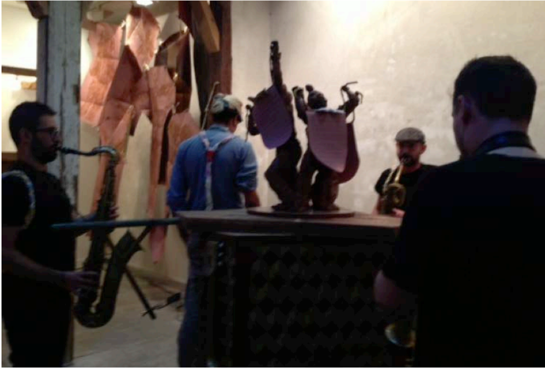
Momento de la performance 3 saxos, artista moviendo el torno