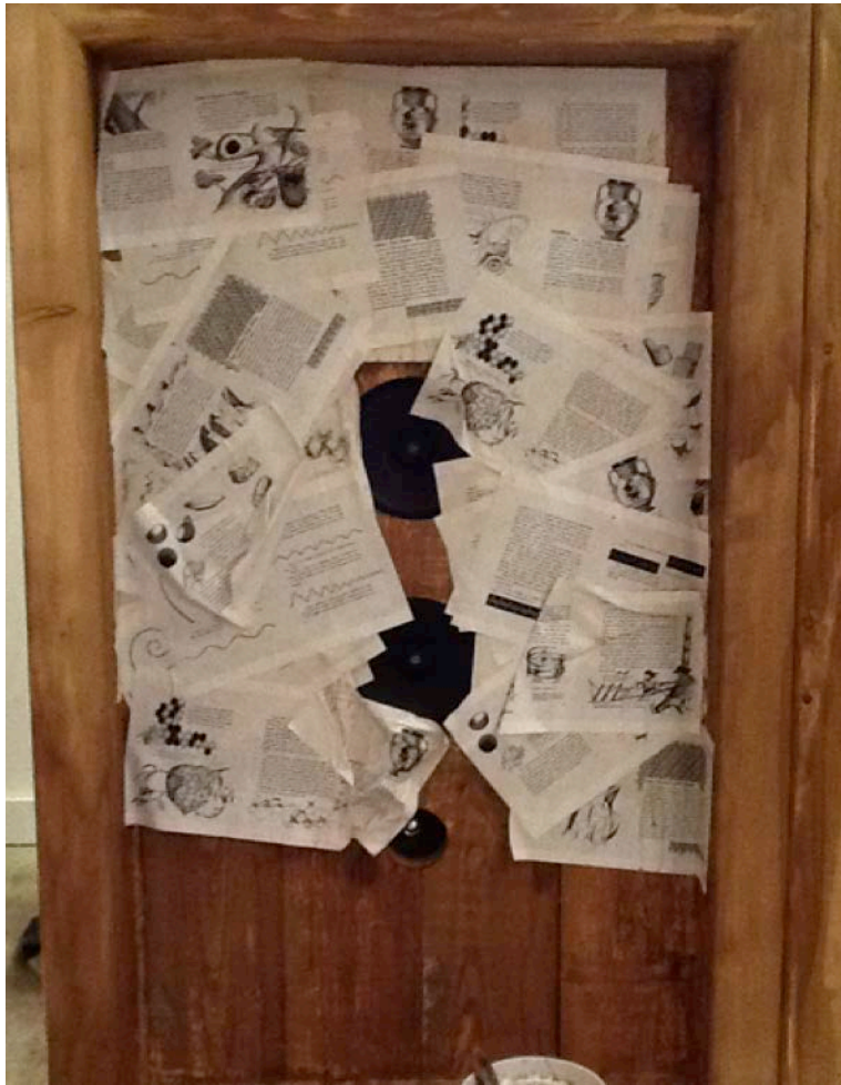
Tap Booth Instalación con sonido Detalle fachada con hojas pegadas