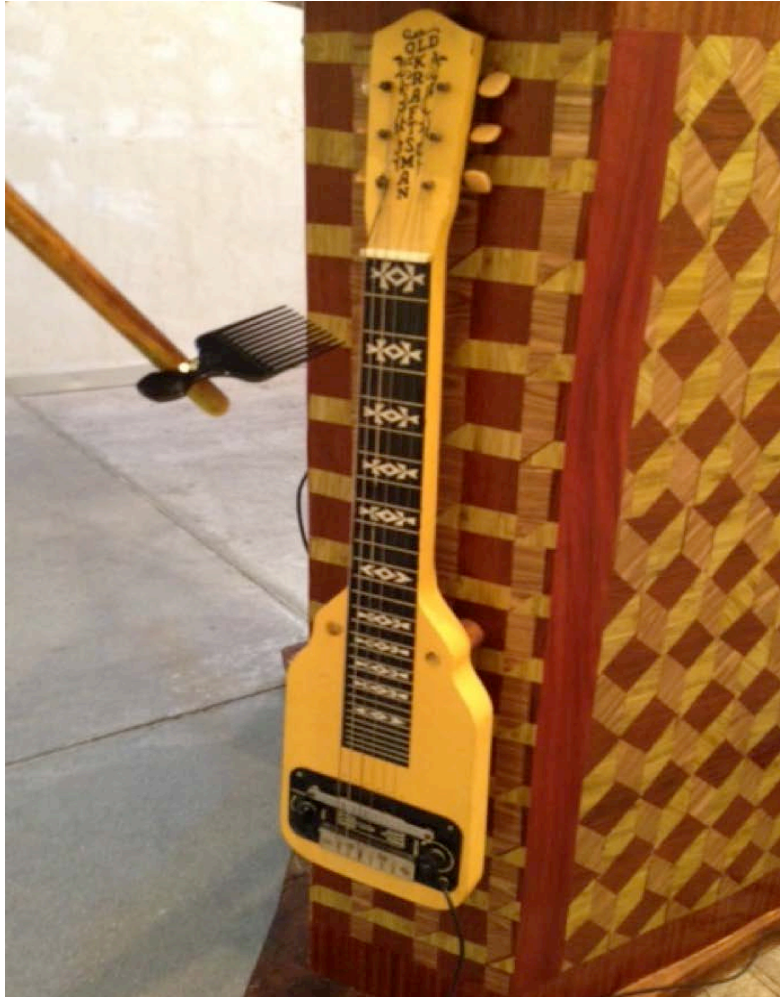
Hurdy Gurdy 2013 Detalle guitarra