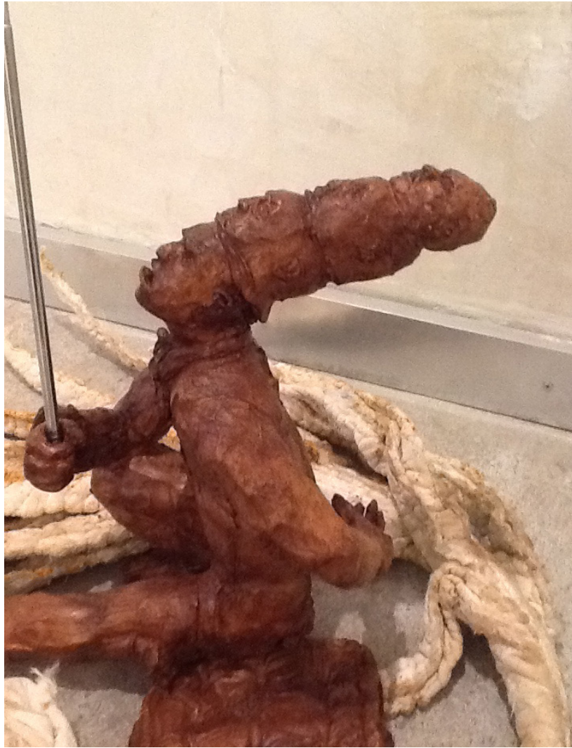
The receiver 2013 Terracota, patchwork y antena 34 x 50 x 49 cm