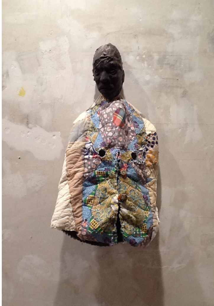
Mascara 2013 Cera, patchwork 52 x 29 x 10 cm