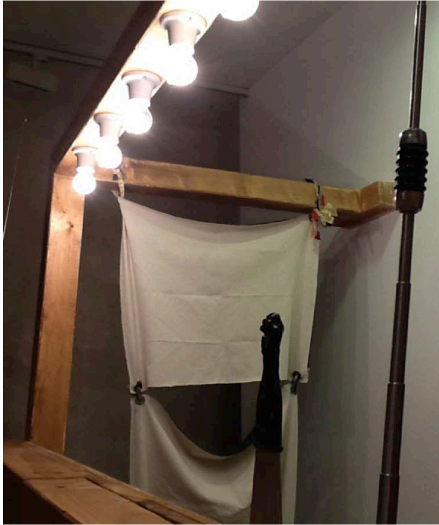
Tap Booth Instalación con sonido Detalles