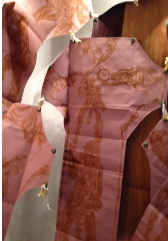
Painted curtain 2013 Detalle pinturas