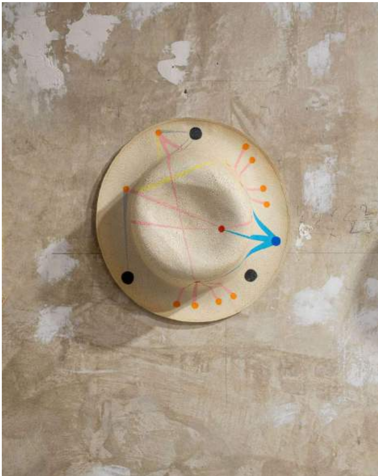
Panama Painting, Al Thani (Qatar)