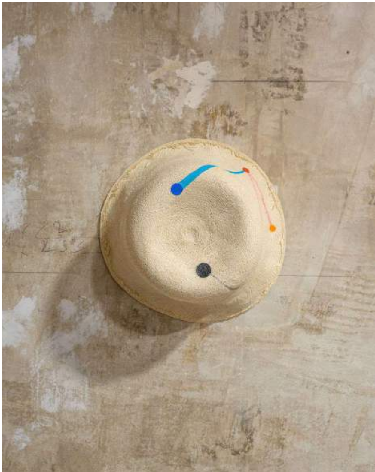
Panama Painting, Zuma (South Africa)