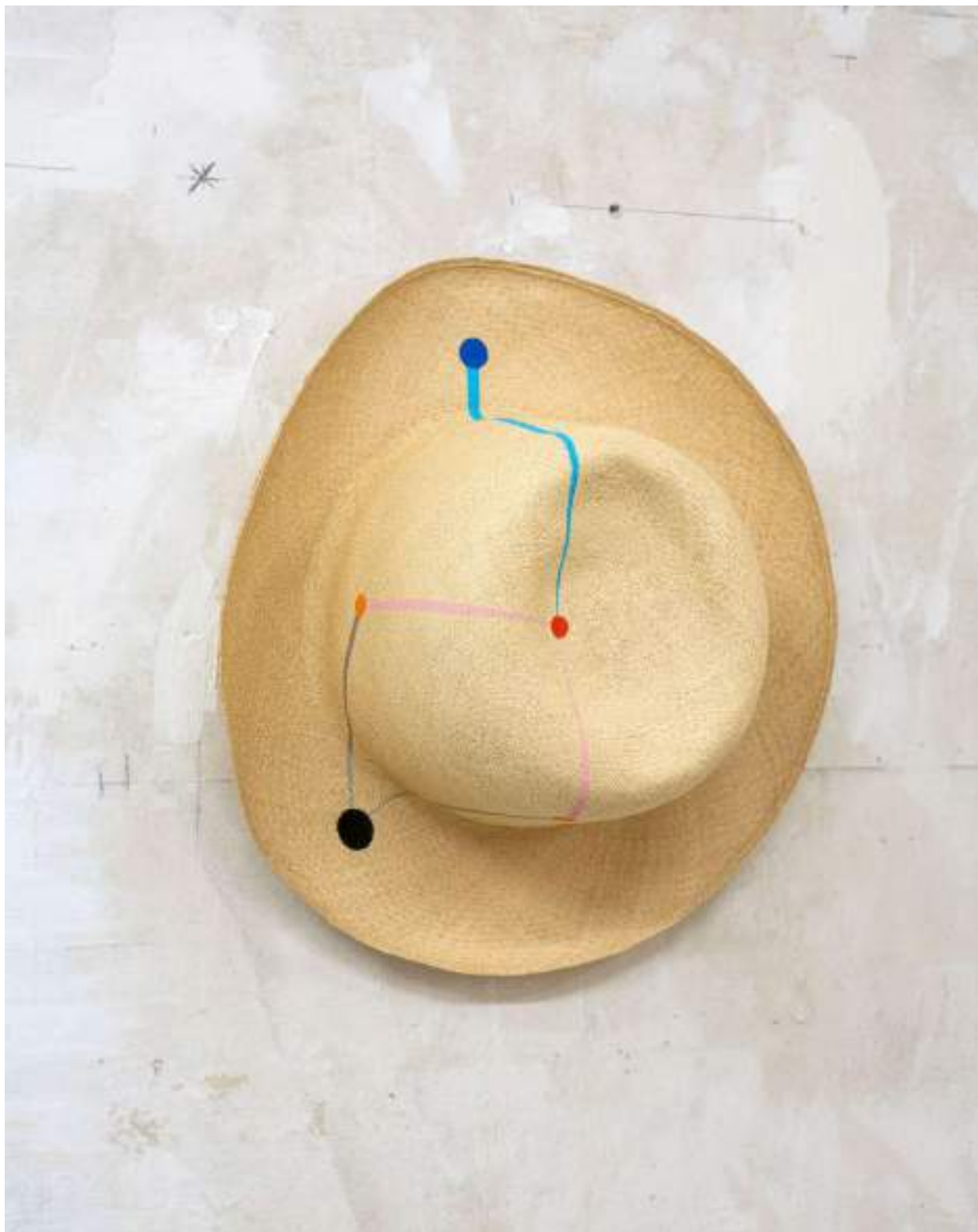
Panama Painting, Gunnlaugsson (Iceland)