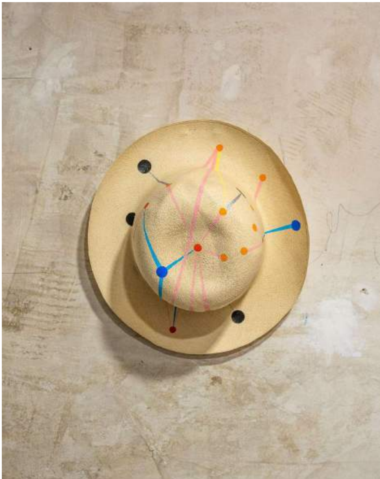
Panama Painting, Roldugin-Putin (Russia)