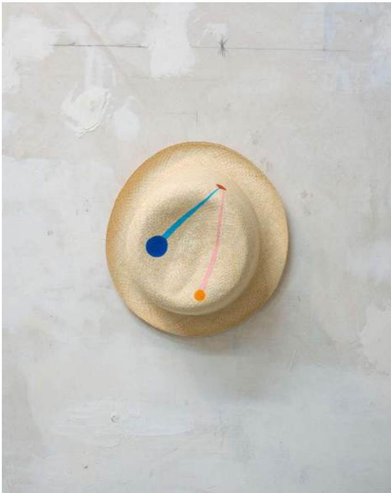
Panama Painting, Macri (Argentina)