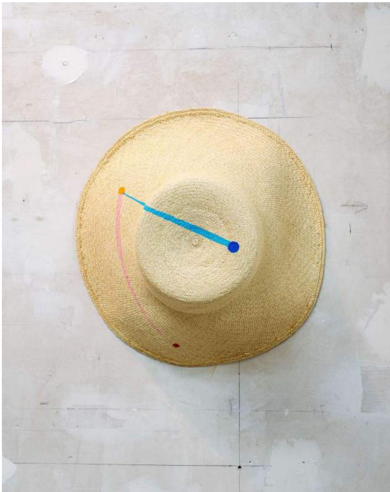
Panama Painting, Cameron (UK)