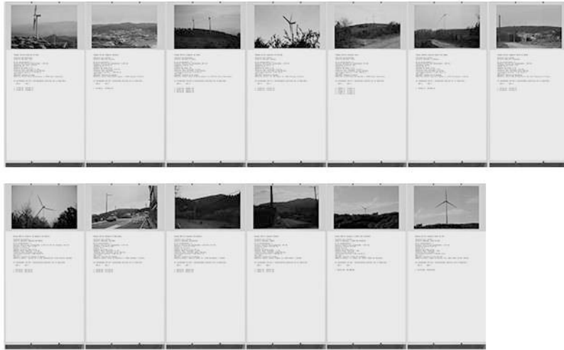
Fig. 3 Simulación de montaje parques eólicos públicos