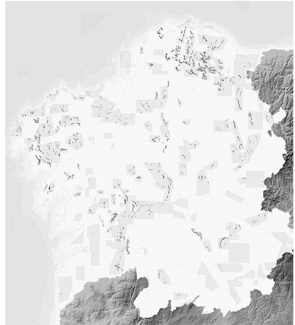
Fig. 1 Mapa de la Comunidad Autónoma de Galicia con los aerogeneradores en explotación. Registro Eólico de Galicia, 2021.

Otros están relacionados con la proximidad de los parques a los núcleos rurales, viviendas, actividades económicas tradicionales del territorio como la agricultura y la ganadería.