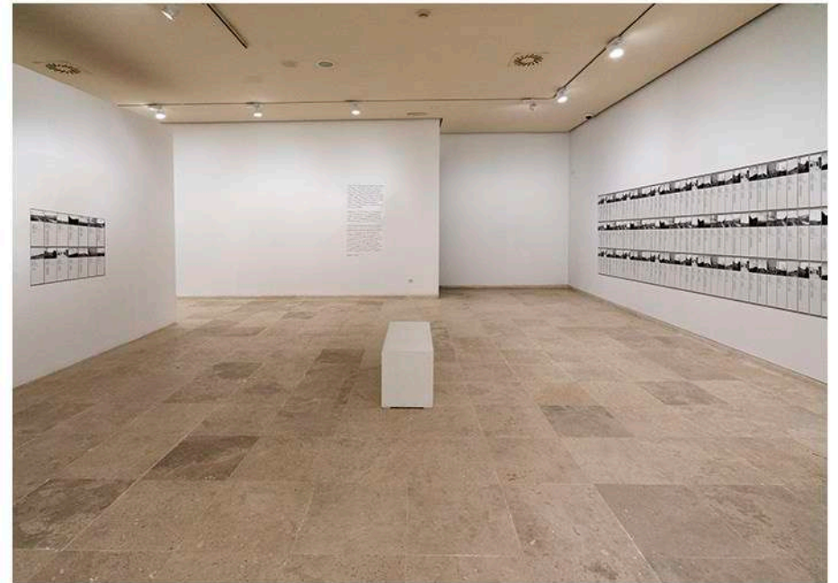
Fig. 5, 6 y 7 Simulación de montaje en sala